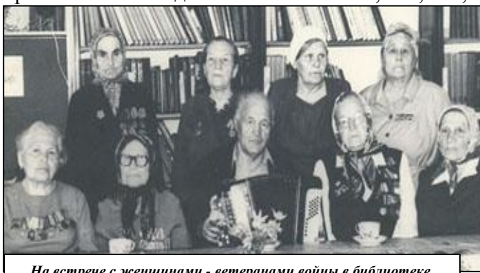
На встрече с женщинами - ветеранами войны в библиотеке.