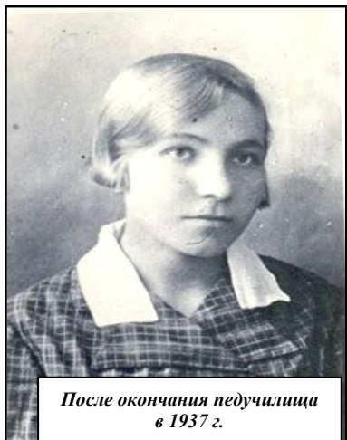
После окончания педучилища в 1937 г.

залась в числе первых 17 выпускников, получивших в 1937 году диплом о среднем специальном библиотечном образовании. Сначала ее хотели направить заведовать районной библиотекой в один из городов Удмуртской АССР, но затем оставили в Ижевске. Первое место работы – Центральная детская библиотека г. Ижевска, библиотекарь читального зала.