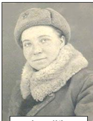
Февраль 1943 г.

Война во все времена считалась мужским, не женским делом. У войны, действительно, не женское лицо. Удивляешься, откуда у хрупкой девчонки взялись силы, чтобы перевоплотиться в бесстрашного солдата, в от- важную свя-