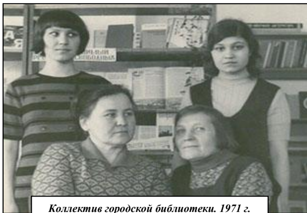
Коллектив городской библиотеки. 1971 г.