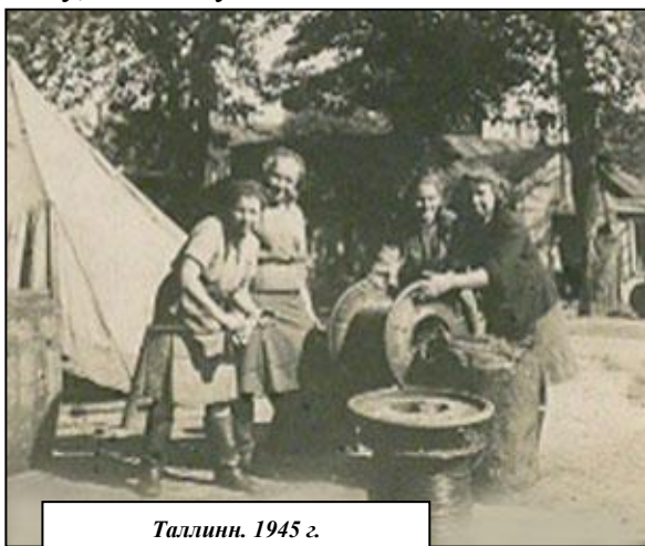
Таллинн. 1945 г.

Эстонию прошли в один день. По дороге наблюдали такую картину, как из кустов выходили немцы и сдавались в плен.